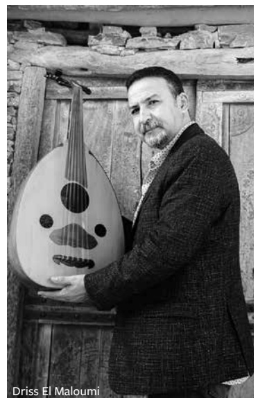
Driss El Maloumi

Het volledige recital van Driss El Maloumi is te beluisteren op · vr 15 september | 22.00 uur | Celrebroederskapel · za 16 september | 16.00 uur | Waalse Kerk