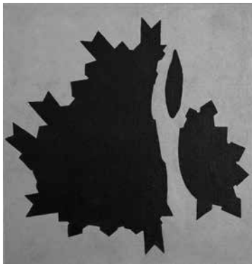
de stad Maastricht © Christiane Steffens