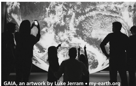
GAIA, an artwork by Luke Jerram • my-earth.org

do 23/9: 15-22u | vr 24 & za 25/9: 11-22u | zo 26/9: 11-17u MAASTRICHTSE GASHOUDER, LAGE FRONTWEG | entree € 3