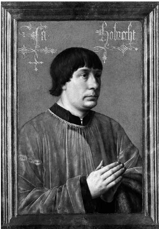
Jacob Obrecht, vermoedelijk geschilderd in het atelier van Hans Memling

'Recent ontdekt bewijs onthult veel over het diepgewortelde ontzag dat Josquin voelde voor de talenten van zijn zeer gerespecteerde medecomponisten, musici en literaire collega's.'