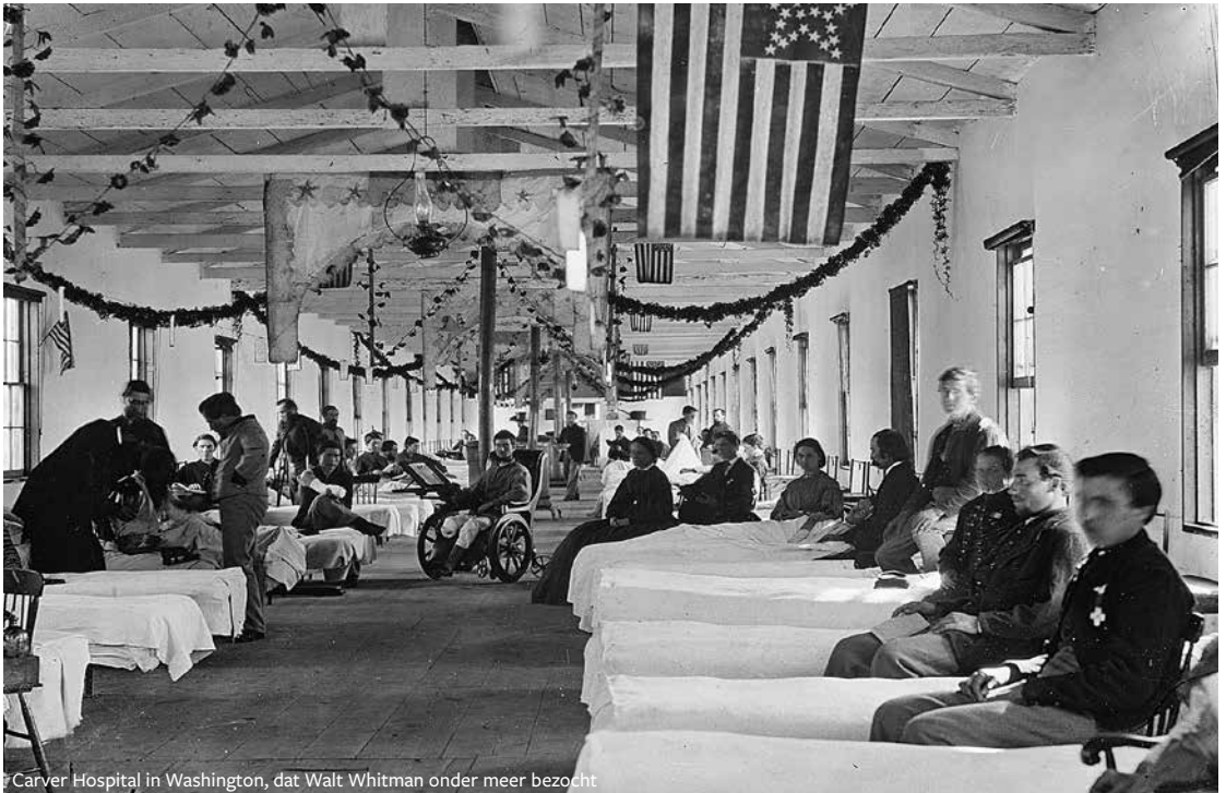
Carver Hospital in Washington, dat Walt Whitman onder meer bezocht

On, on I go, (open doors of time! open hospital doors!) The crush'd head I dress, (poor crazed hand tear not the bandage away,) The neck of the cavalry-man with the bullet through and through I examine, Hard the breathing rattles, quite glazed already the eye, yet life struggles hard, (Come sweet death! be persuaded O beautiful death! In mercy come quickly.)