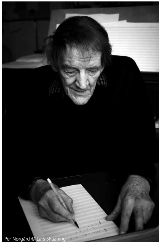
Per Nørgård

overstellen. Nørgård ontwikkelde in deze periode een doordachte, maar vrije reeksen- en collagestijl. Op latere leeftijd, in de jaren negentig, oriënteerde hij zich in toenemende mate op het romantisch-expressionistische verleden. Kwaadsprekers betichtten hem toentertijd van een nabijheid van zijn werken tot kitsch. Høsttidløs , met de voordrachtsaanwijzing 'Allegro fluente', voor strijkkwartet ontstaat in 2005. De inmiddels emeritus hoogleraar compositie bewoont een huis met tuin in de buurt van Kopenhagen. De herfstijloos – aldus de vertaling van de Deense titel – is een krokusachtige, paarse, zeer giftige bloem die nog eenmaal de lente in herinnering roept, maar eigenlijk een voorbode van de winter is. Welluidende, romantische klanken maken plaats voor experimentele, fragmentarische motieven en nerveuze bewegingen. Ten slotte verdwijnt de muziek met verloren glissandi en getokkelde tonen in het nergens. Het werk heeft iets van een nostalgische terugblik en is tegelijkertijd een waarschuwing voor een bedrieglijke toekomst.