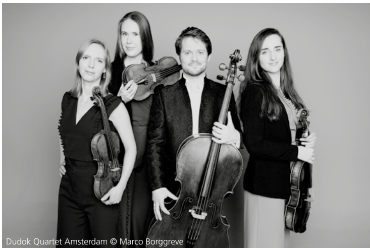
Dudok Quartet Amsterdam