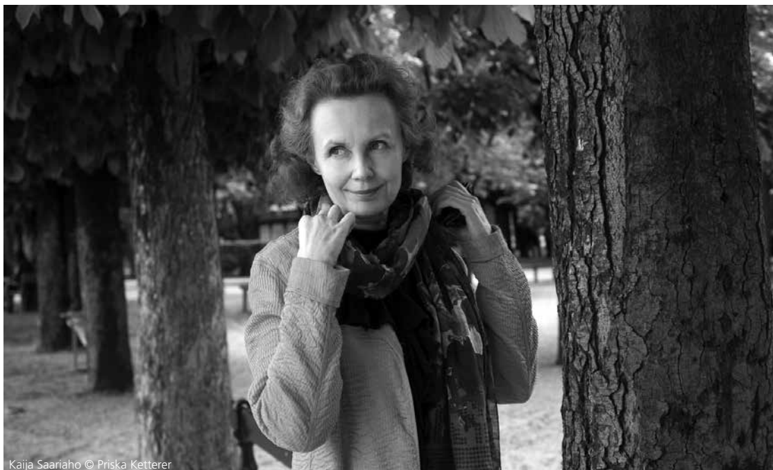
Kaia Saariaho