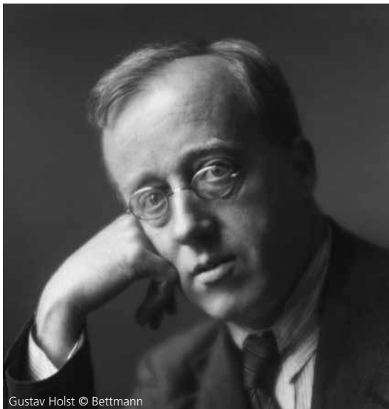
Gustav Holst